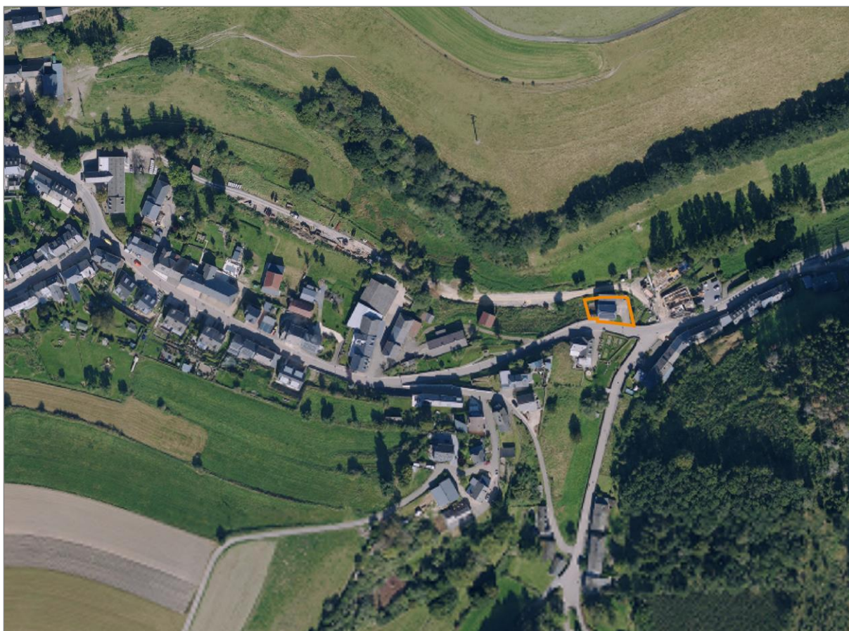
Abb. 1: Abgrenzung des Plangebietes der punktuellen PAP QE-Änderung mit der geplanten Ausweisung zum „quartier existant – espace résidentiel“ (orange) in der Ortschaft Arsdorf.

Im aktuell rechtsgültigen PAP „quartier existant“ der Gemeinde Rambrouch liegt das Plangebiet außerhalb des Geltungsbereiches des PAP „quartier existant“ entsprechend den Ausweisungen des PAG („zone agricole“ im PAG en vigueur). Entsprechend den geplanten Ausweisungen des PAG modifié soll die Fläche als „quartier existant – espace résidentiel“ ausgewiesen werden.