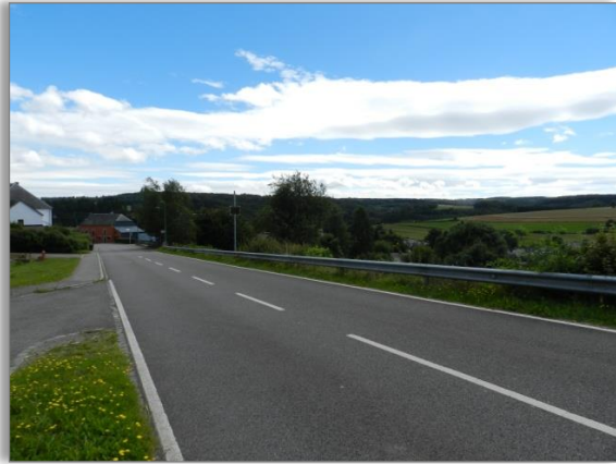
Abb. 1: Blick entlang der nördlichen Plangebietsgrenze an der „Rue du Lac“