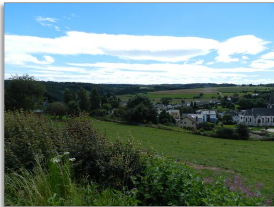
Abb. 3: Blick von der westlichen Plangebietsgrenze an der „Rue du Lac“ nach Süden