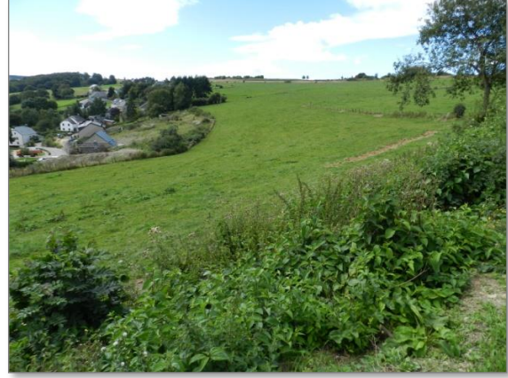
Abb. 2: Blick von der östlichen Plangebietsgrenze an der „Rue du Lac“ nach Südwesten