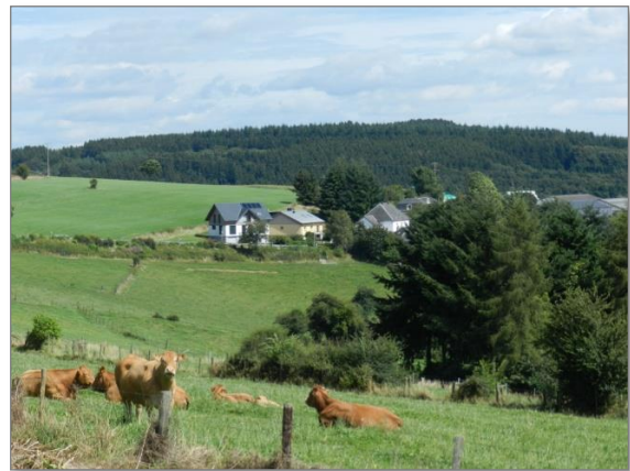
Abb. 4: Blick vom „Neimilleschpad“ aus Westen auf das Plangebiet (Fernsicht)